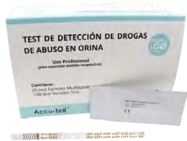
Test de detección orina 100 ud