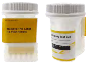
Multi drogas con copa integrada/Term