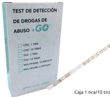
Caja 1 tira/10 tiras

Los productos sanitarios de Laboratorios Pharma & GO cumplen con las exigencias del nuevo reglamento según el MDR (UE) 2015/745.